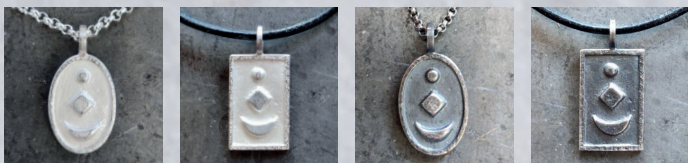
OVAL/ECKIG IN SILBER, (WEISS ODER GESCHWÄRZT), 63,00 €